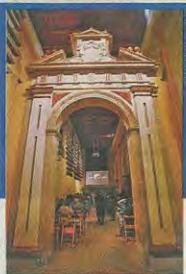
光臨祇深獲遊客歡迎，惟全場不得拍攝。

天主教堂的部分，從 13 世紀開始建造，其後的 5 個世紀各主教不斷加建，其中 14 世紀興建的 Royal Chapel，滿有文藝復興與的瑰麗；18 世紀完成的主教堂，具哥德式的工整，全大理石打造出聖潔的氣氛。一寺兩宗教，相互較勁，這也教我不禁問宗教的力量何其大？直教前人窮畢生的時間、精力，奉獻予其信奉的真神。