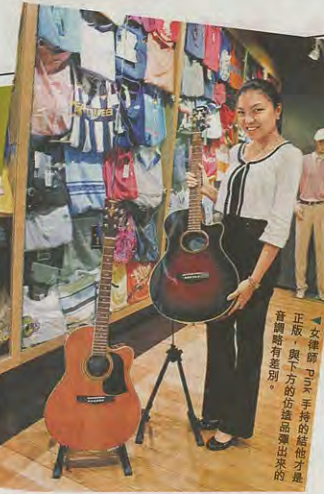
「女律師」手持的結他才是真貨，與下方的仿造品比出來的音調有差別。